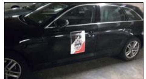
Vorort-Limousine des WSC mit Wappen.