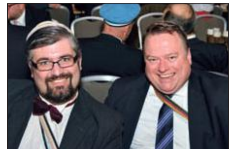
Beste Kommersstimmung beim WVAC-Vorsitzenden. (re.)