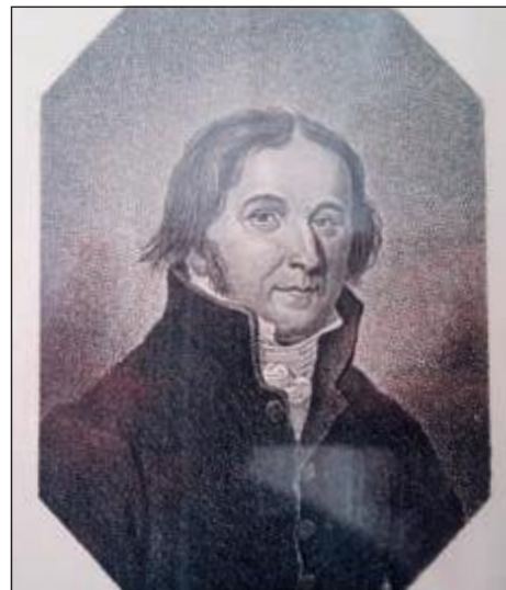
Arndt-Portrait auf dem Corpshaus der Marchia Greifswald.

Diese Vorgehensweise ist geeignet Mißtrauen zu verfestigen. Nicht nur über die Art, wie eine Umbenennung hinter verschlossenen Türen regelrecht erzwungen werden soll, sondern vor allem über die dieser Vorgehensweise innewohnenden verkürzten Rezeption Arndts. Es ist übrigens durchaus so, daß sich insbesondere Corpsstudenten genug Anlaß böte, gegen Arndts burschenschaftsaffine Polemiken aus dem frühen 19. Jahrhundert nachzukarten. Problematische Auffassungen Arndts nur aus heutiger Sicht zu bewerten, wäre jedoch gleichbedeutend mit dem Ende seriöser Geschichtswissenschaft. Nationales Denken, ein Wirken gegen die Kleinstaaterei und Feudalismus waren im frühen 19. Jahrhundert Ausdruck einer Demokratisierung. Vor diesem Eindruck analysierte der Historiker Götz Aly die Arndt-Debatte am 23. Januar in der Berliner Zeitung als einen Spezialfall des Geschichtsexorzismus. Dessen