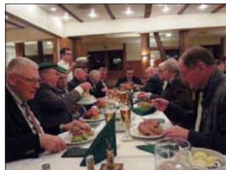
Beim traditionellen Eisbein.