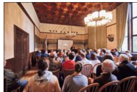
Große Beteiligung auf dem Rhenanienhaus.

schon sehr lange zurückliegen können. Beim weit überwiegenden Teil der Konsumenten mit Konsumerfahrungen bleibt es beim vorübergehenden, sogenannten passageren oder experimentellen Konsum innerhalb umschriebener Lebensphasen.