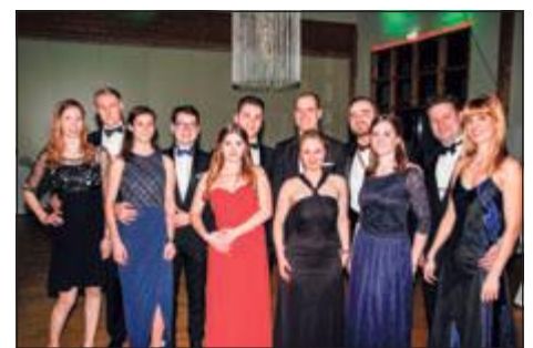
Beim Darmstädter SC-Ball.