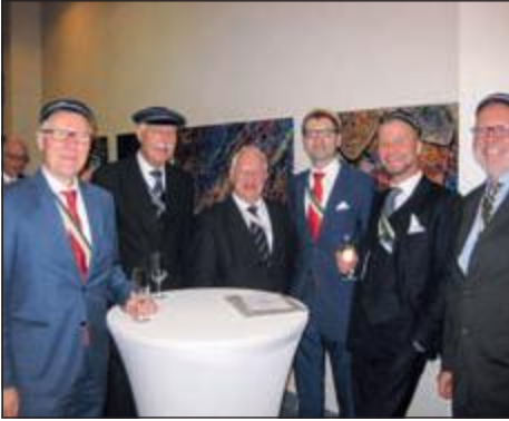
Vestfals (4.v.l.) vor dem Festakt.