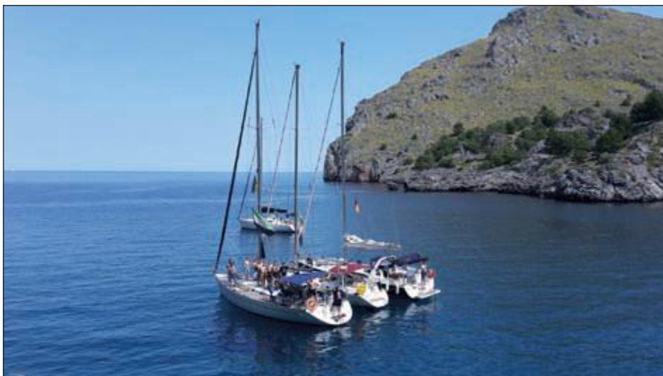
Gemäß Verabredung liegen drei Corpsyachten im Päckchen vor Anker.

Dazu laden wir alle Aktiven-, Inaktiven- und Altherrenmannschaften zur Kontaktauf-