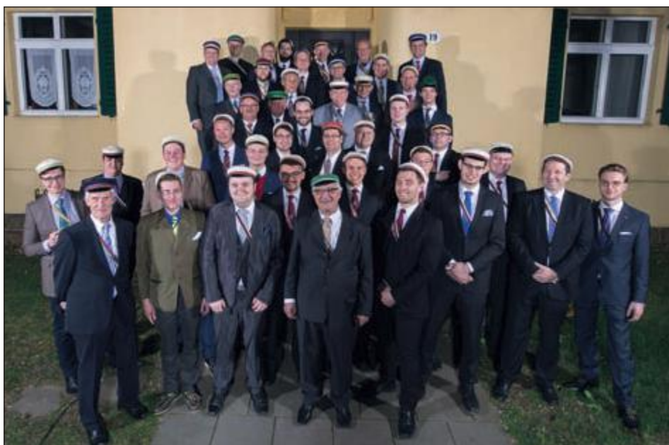
Vor dem Corpshaus der Teutonia.