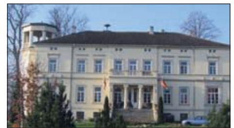
Gutshaus Mühlenbeck.