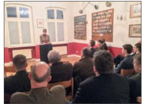
Auf dem Märkerhaus.

Im Verlauf der Diskussion gaben insbesondere zwei Aspekte jedoch Anlaß zur Skepsis gegen zu hohe Erwartungen an durchsetzbare Änderungen der Jagdgesetze. Zunächst betreffe das propagierte verzeitgeistigte Verständnis von der Jagd. Der Jäger werde kaum mehr als Natur- und Tierschützer benannt und wahrgenommen, der er nachweislich tatsächlich ist, sondern zunehmend als moralisch fragwürdig. Ein solches Verständnis komme nicht von ungefähr, sondern werde durch die Medien gezielt geweckt. Natur- und Tierschutzverbände haben sich mit eigenen Geschäfts- und