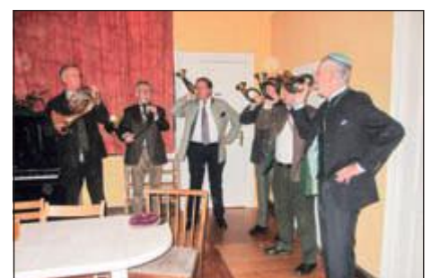
Begrüßung der Gäste durch Wehrmann Isariae (re.)