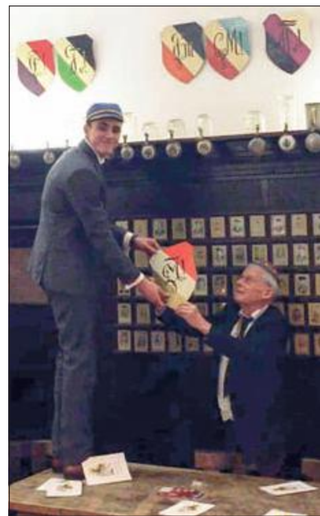
Weiß Lusatae EM, Marchiae Berlin (re.) reicht Wappenschild.

(Quellen: Lausitzer-Zeitung 1/2017 (März); Berliner Märker Blätter Nr.137 März 2017 und Detjen, Marion: Ein Loch in der Mauer. Die Geschichte der Fluchthilfe im geteilten Deutschland )