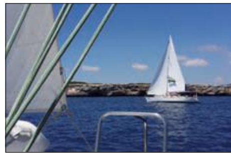
Farbe bekennen und Flagge zeigen.

nahme – schon jetzt gerne für das Jahr 2018 – herzlich ein.