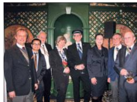
Mit Gästen aus dem Magdeburger Kreis.