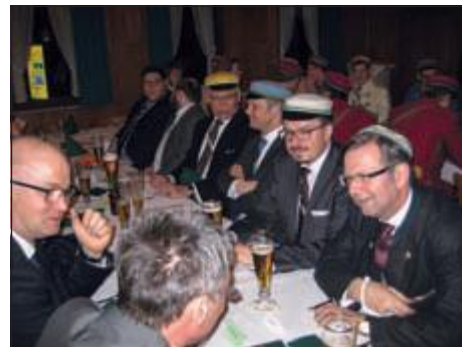
Angeregter Austausch mit Gästen.