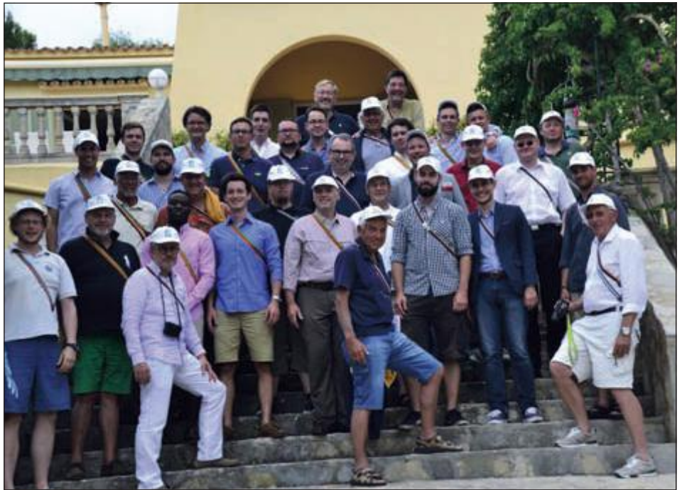
Die Crewmitglieder des großen Corpsegeltörns.

Die Motivation aller Teilnehmer war kaum zu bremsen. Zahlreiche Corpsstudenten kannten sich von anderen Veranstaltungen