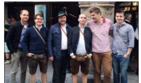
Zünftig auf dem Oktoberfest.