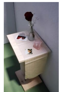
Blick in eine Kabine mit persönlichen Accessoires