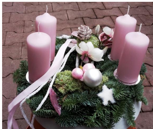
Kerzen im Advent

Idee: Schweizer JSJ-Praktikertreffen Realisation: Herbert Schrepfer, Abtwil kontakt@lebens-oase.ch