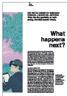
Veröffentlichungen in architektur+technik