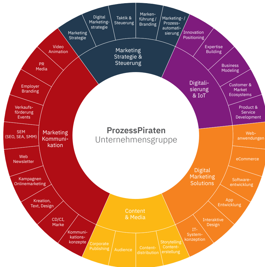
Leistungsportfolio der ProzessPiraten

ProzessPiraten sind überzeugt, dass die Digitalisierung in der Bauwirtschaft mit neuen Marketing- und Kommunikationsprozessen besser läuft.