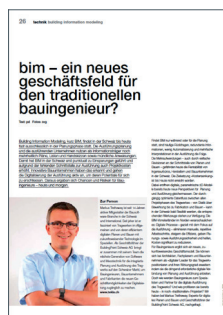
Veröffentlichungen in der-bauingenieur