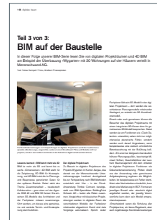
3-teilige Serie „BIM auf der Baustelle“ in „die baustellen“