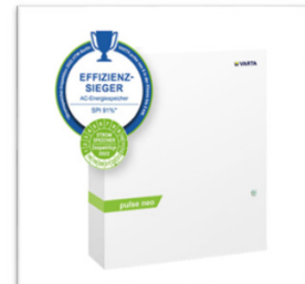
Varta Element Backup Speicher