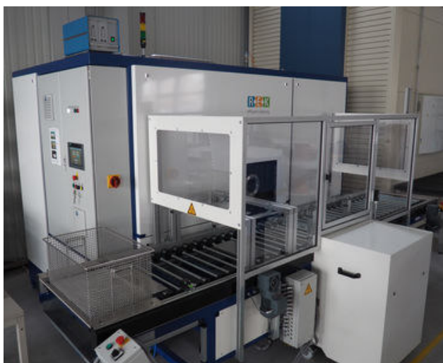
(fileadmin/redaktion_dir/_processed_ /csm_170313_REK_Reinigungsanlage_11306453f3.jpg) REK Reinigungsanlage

Die neue REK Reinigungsanlage bietet uns somit eine umweltschonende und energieeffiziente Reinigung. Ihnen überzeugende Reinigungsergebnisse und uns allen eine optimierte Prozessüberwachung und einen hohen Sicherheitsstandard.