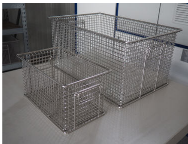
(fileadmin/redaktion_dir/_processed_ /csm_170313_REK_Groessenvergleich_Ko 6453f3.jpg) Groessenvergleich der Reinigungskörbe. Links bisherige Korbgröße - Rechts neue Korbgröße