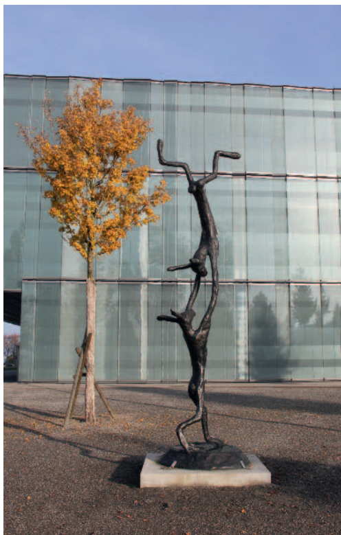
Barry Flanagan Acrobats 1997 Bronze 443 x 165 x 125 cm Sammlung Würth, Inv. 8612

The exhibition is accompanied by a catalogue published by Swiridoff Verlag.