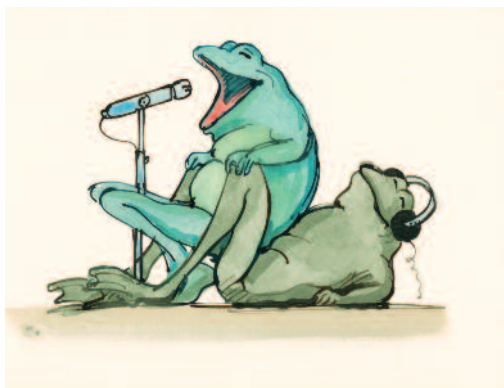
Tomi Ungerer Kamasutra der Frösche 2: Singende Frösche/ Kamasutra of the Frogs 2: Singing Frogs 1984 Farbige Tusche auf Papier Coloured ink on paper 19 x 30 cm Sammlung Würth, Inv. 6102

Unsere Vorstellungen über Tiere sind also kräftig in Bewegung geraten und während wir uns in unserem Alltag zwischen Grillwurst und Gassigehen eingerichtet haben, zeigen Künstler uns Tiere aus ihren bisweilen höchst