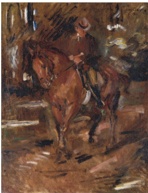
Lovis Corinth Der Morgenritt / The Morning Ride 1911 Öl auf Leinwand/ Oil on canvas 110 x 87 cm Sammlung Würth, Inv. 9399

risch ins Fantastische zu steigern. So änderte sich unsere Vorstellung vom Wesen der Tiere von Epoche zu Epoche. Je deutlicher aber unser Wissen um unsere, auch wissenschaft-